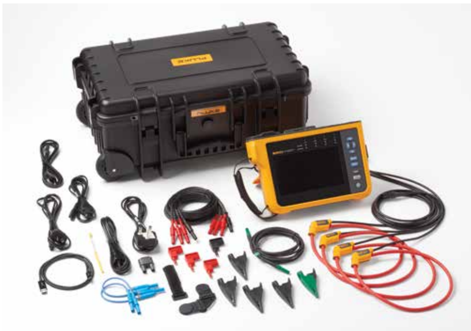
Netzqualitätsanalysator Fluke 1777. Hinweis: Die enthaltenen Artikel variieren je nach Modell und sind in der Tabelle Bestellinformationen aufgeführt.