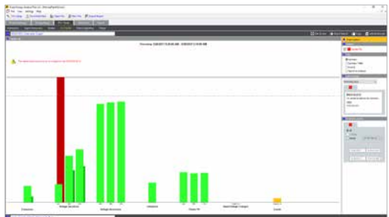
Fluke Energy Analyze Plus: Übersicht über den Zustand der Netzqualität